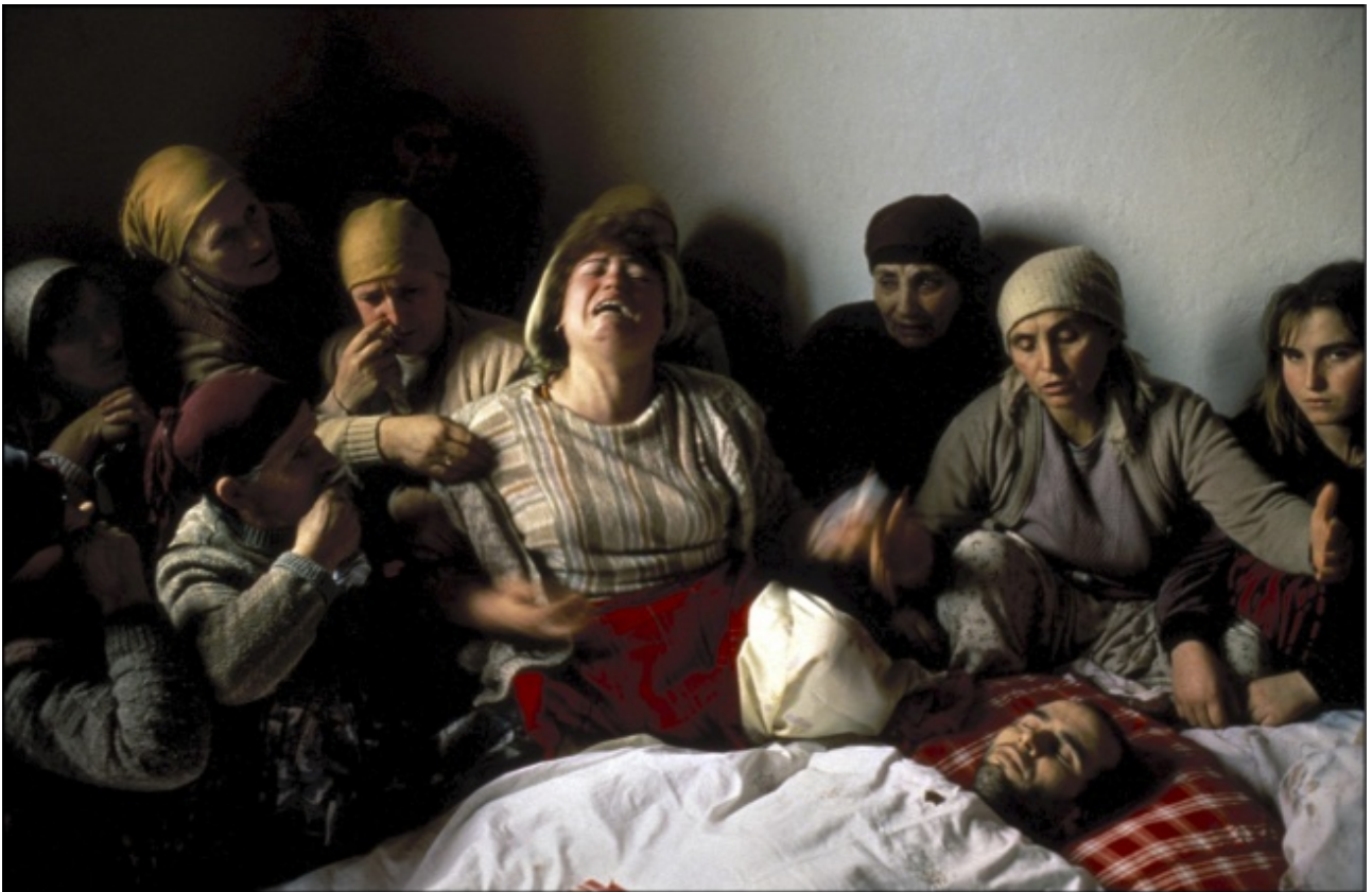
Georges Méryllon, Pietà del Kosovo, 1990

A questo punto, l'anacronismo non è più una soluzione di comodo volta a interpretare il passato alla luce delle nostre sole categorie presenti, ma è una soluzione complessa, volta a comprendere ogni presente storico come costituito da nodi temporali molto eccentrici. La scuola degli Annali ha avuto il merito di distinguere tempi differenti nella storia, fenomeni di lunga durata o avvenimenti precisi. Forse, occorre considerare che in ogni immagine questi tempi coesistono e creano una complessità che ci richiede tempo e pazienza per l'analisi. Lei mi domanda perché l'immagine costituisca il vettore essenziale di questa complessità storica. Ebbene, le risponderò semplicemente dicendo che i due autori che hanno senza dubbio analizzato meglio tale sedimentazione memoriale della storia, cioè Aby Warburg e Walter Benjamin, hanno fatto del tempo la vera dimensione dell'immagine e, specularmente, dell'immagine la vera dimensione – la “leggibilità” come diceva Benjamin – della storia. Per questo, dopo aver scritto un libro intitolato Devant l'image , avevo bisogno di completarlo con un altro che si intitola Devant le temps .