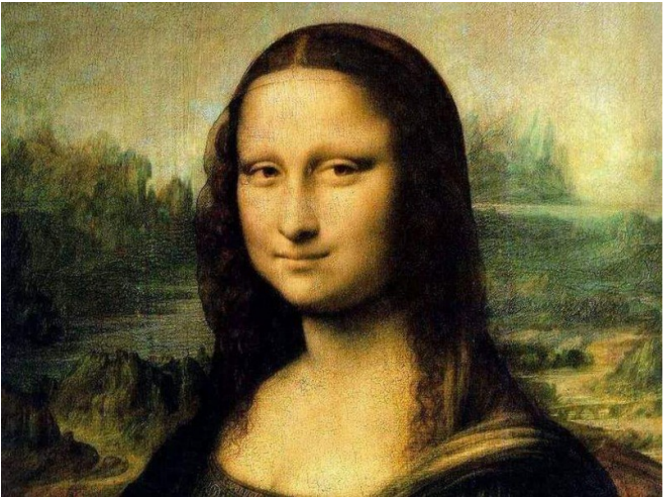
Leonardo da Vinci, La Gioconda, particolare, 1503-1517

aristocratico, ecco oramai una donna fluttuante nel cielo... Ciò che voglio dire con questo esempio banale è che l'apparizione è una dimensione essenziale della nostra esperienza delle immagini: ogni vedere mette in discussione e rimette in gioco tutto un sapere , tutto il sapere. Le immagini mediatiche che lei evoca sono un'altra questione: in quanto immagini esse chiedono di essere viste e giudicate, ma in quanto mediatiche non sono veicolate attraverso l'apparizione ma sono piuttosto bombardate... Ciò che appare mi colpisce veramente, mentre le immagini mediatiche hanno quasi sempre l'aria di provenire dall'alto, come lanciate da un nostro satellite di telecomunicazioni o dalle nostre istituzioni del potere.