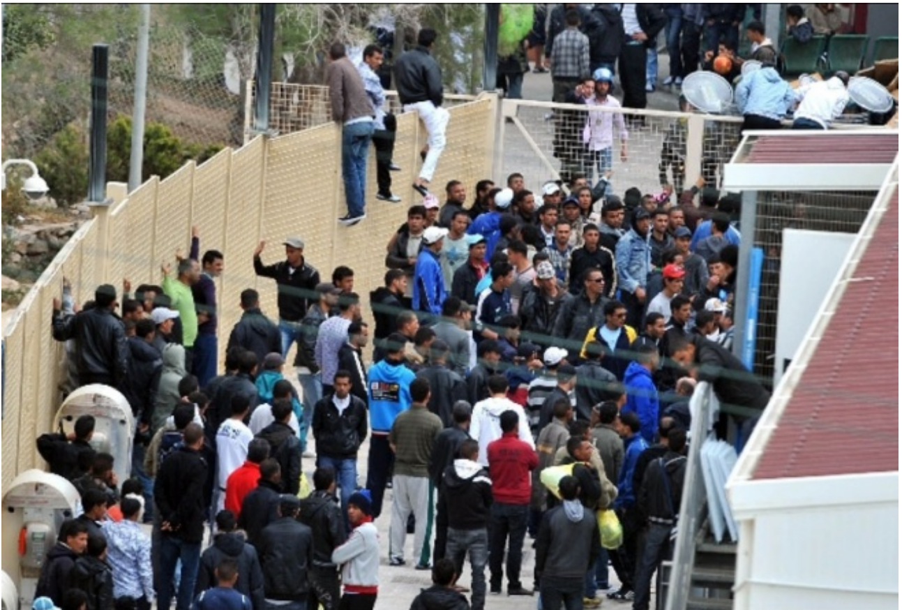
Centro d'accoglienza Porto empedocle

Il lavoro dello storico delle immagini, per quanto modesto egli sia, non si approssima solamente ad una archeologia , perché essa riporta alla luce ciò che la rappresentazione mediatica tende a seppellire, ma piuttosto a una presa di posizione critica volta a sollevare una memoria nell'attualità o un'attualità nella storia. È quello che potremmo definire il carattere intempestivo di ogni analisi che deriva dalle immagini.